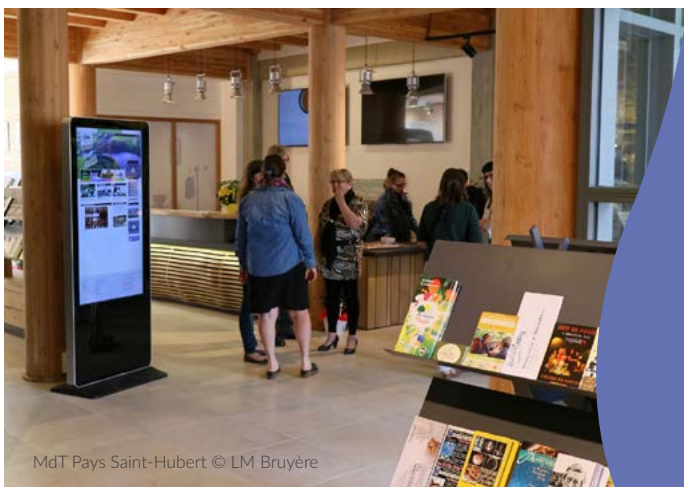
MdT Pays Saint-Hubert